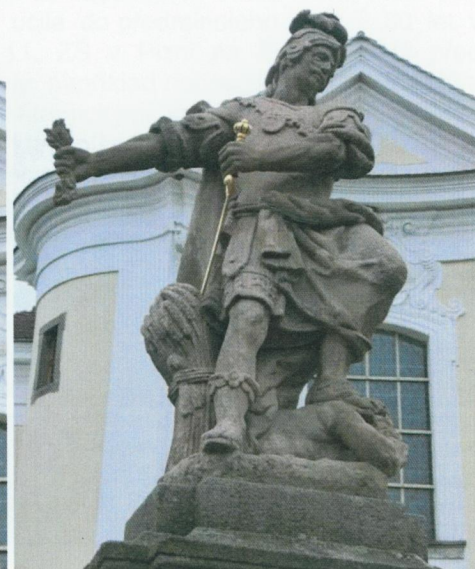
Svatý Pavel v říjnu 2015