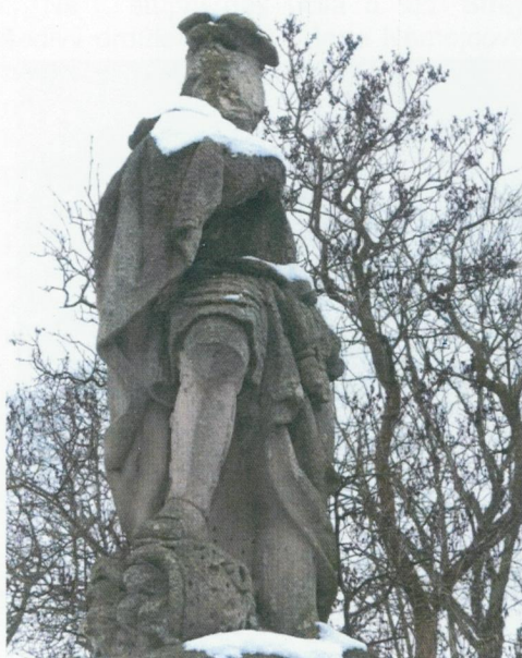
Torzální stav sochy sv. Jana v r. 2013

Text a foto Pavel Motejzík, Mikroregion Nepomucko