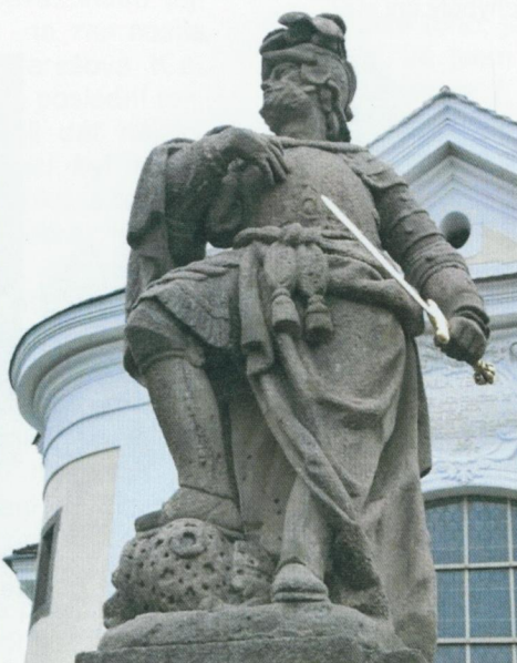
Svatý Jan v říjnu 2015