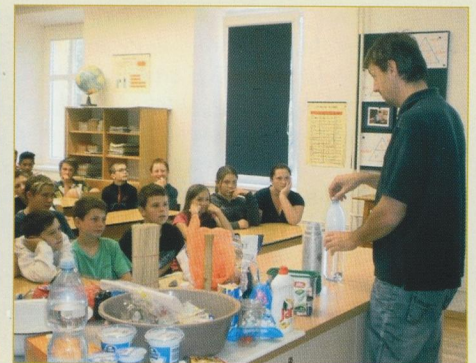
Show s tekutým dusíkem