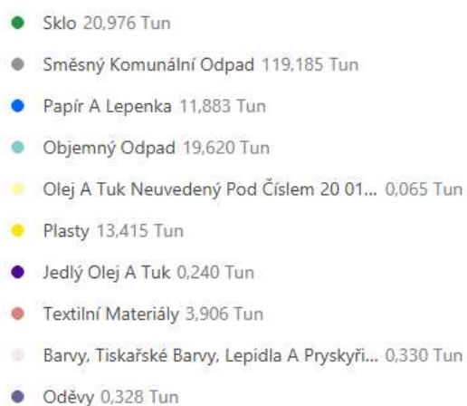
Tabulka č. 1