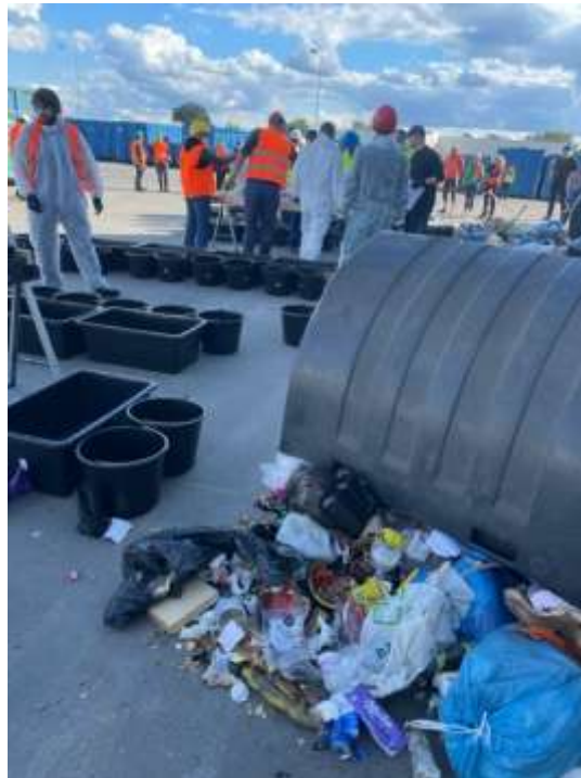
Ilustrační foto č. 4 – provádění rozboru smíšeného komunálního odpadu

Objemný odpad odevzdávají občané na sběrném dvoře, nebo pověřené odborné firmě do přistavených velkoobjemových kontejnerů, a také při mobilním sběru přímo do svozového vozidla podle instrukcí obsluhy. Při přebírání objemného odpadu zajišťuje přebírající obsluha oddělení recyklovatelných složek (minimálně kovů, plastů a dřeva velkých rozměrů). Odborná firma následně zajišťuje další úpravu objemného odpadu s cílem získat z něj využitelné složky, jako například dřevo, plast, kovy, sklo za účelem jejich recyklace, či jej využívá jako složku pro alternativní palivo, nevyužitelný zbytek je obvykle uložen na skládce nebo využit pro výrobu tuhého alternativního paliva, případně je spálen ve spalovně komunálních odpadů.