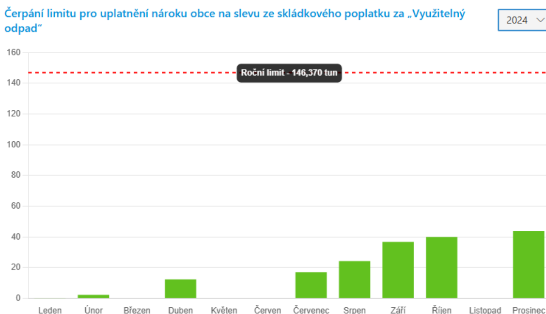
Graf č. 5

Do doby dosažení ročního limitu jsme platili skládkový poplatek 500,- Kč/t a po překročení limitní hranice se poplatek zvedl na 1250,- Kč/t.